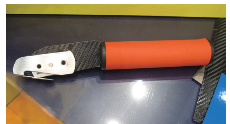
離型紙のみをカットする「ボディガードナイフ」。