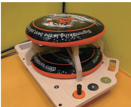
各種ツールの置き場所を備えた「キャスター付き作業椅子」。