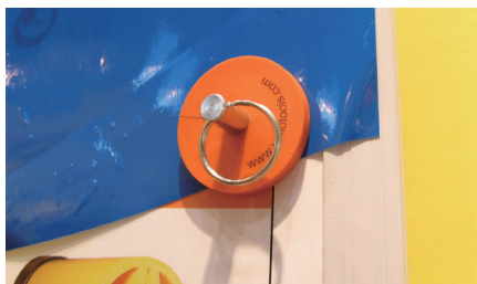
フィルムを仮留めするための「カーマグネット」も種類が豊富。